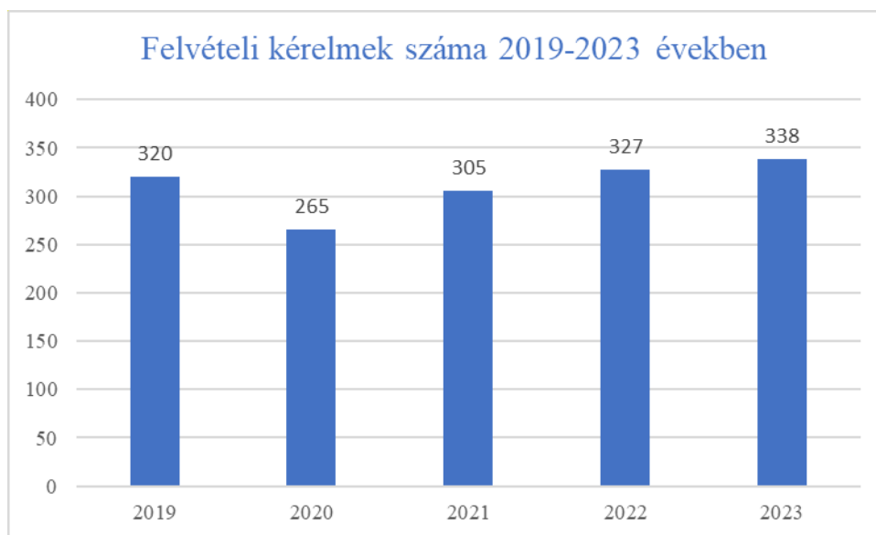
4. sz ábra Felvételi kérelmek száma 2019-2023 években

2023-ban megfigyelhető volt, hogy a gyermekfelvételek száma az elmúlt évhez viszonyítva némiképp tovább emelkedett, és a Covid előtti időszakot is meghaladta. Míg 2019-ben 320 gyermek felvételi határozata született meg, addig 2020-ban jelentősen kevesebb, 265 család kérésére biztosítottunk bölcsődei elhelyezést. Ez 2021-ben emelkedett és már 305, 2022-ben 327, míg 2023-ban 338 gyermek számára került elkészítésre a felvételi határozat. A felvétel, a 2023-as évben is egész évben folyamatos volt, míg a beszoktatás megkezdését is rugalmasan tudtuk kezelni, attól függően, hogy a szülő mikor tudott visszakérülni a munkaerőpiacra, vagy kezdte meg nappali rendszerű képzését.